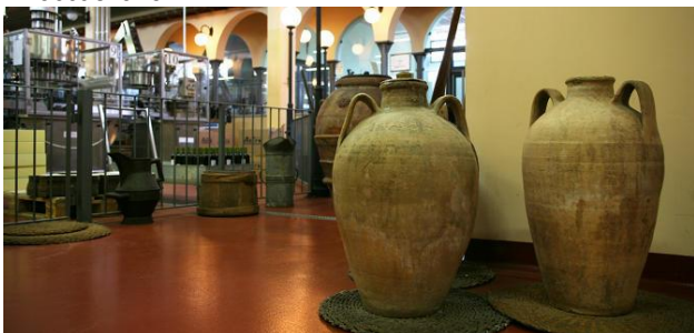
Particolare Interno del Frantoio Soc. Agricola Trevi

Al termine della visita tutti gli intervenuti hanno raggiunto il ristorante dove hanno potuto assaporare delle pietanze tipiche del luogo. A pranzo concluso, il Presidente del C.U.A.E. ha fatto distribuire gli omaggi che naturalmente altro non potevano essere che una bottiglia di olio novello ed una confezione di pasta di olive.